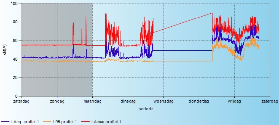
Grafiek 2 : Dag overzicht 11-10-2013